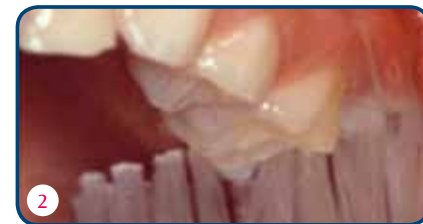
Als je de tanden in de lengterichting poetst, sla je de nieuwe blijvende kies die doorbreekt over (foto 1). Juist de nieuwe kiezen zijn extra kwetsbaar. Zet de tandenborstel daar dwars op de tandenrij (foto 2).