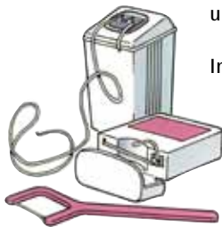
Flosshouders en flossboogje

Flossdraad is verkrijgbaar in verschillende soorten en dikten, met en zonder waslaagje. Sommige mensen gebruiken liever een flossboogje. Overleg met uw tandarts of mondhygiënist welk flossdraad u het beste kunt gebruiken.