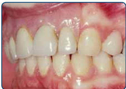
Plaatprothese van opzij