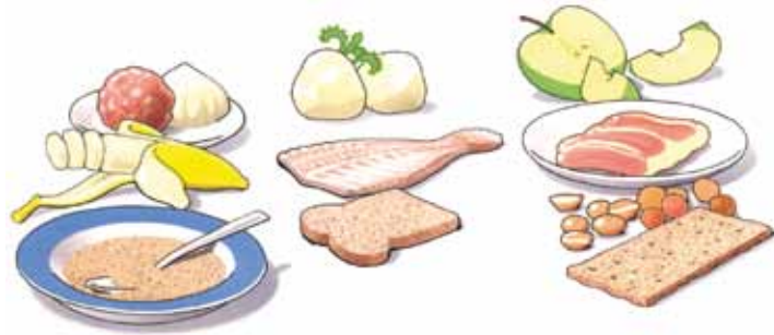
Probeer langzaam hardere dingen te gaan eten

Eten met uw nieuwe overkappingsprothese is wat onwennig. Zeker in het begin zult u voorzichtig aan doen. U ervaart zelf het beste wat wel en niet kan. Probeer langzaam hardere dingen te gaan eten. Stukken afbijten kunt u met een kunstgebit beter niet doen. Snijd uw voedsel daarom in stukjes en kauw rustig en gelijkmatig met de kunstkiezen. Neem daarbij aan beide zijden een stukje voedsel in de mond. Neem er meer tijd voor dan dat u gewend was.