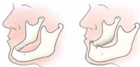
Met een overkappingsprothese slinken uw kaken minder snel

Als enkele wortels van uw tanden of kiezen behouden kunnen blijven, kan het slinken van uw kaken voor een groot deel worden voorkomen. De druk die ontstaat door het kauwen, wordt bij een ‘gewoon’ kunstgebit opgevangen door de tandeloze kaken. Bij een overkappingsprothese wordt die voor een belangrijk deel opgevangen door de pijlers onder het kunstgebit. Hierdoor slinken de kaken veel minder snel.