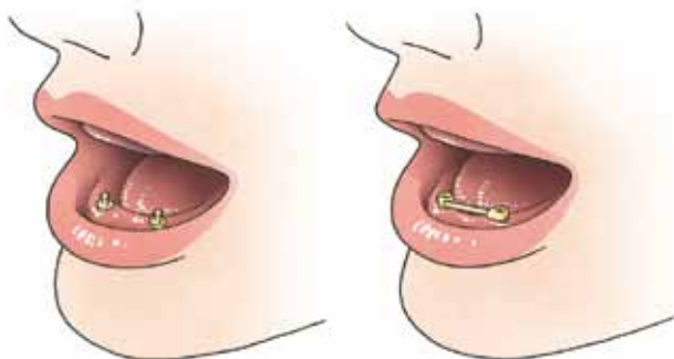
Extra voorzieningen: drukkнопjes (l) en een staafje (r)

knopjes, aanzienlijk meer houvast geven aan de overkappingsprothese. In beide gevallen heeft u soms een geheel nieuwe overkappingsprothese nodig.