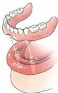
Enkele wortels van uw tanden of kiezen worden als pijlers gebruikt

U krijgt een overkappingsprothese. Dat is een grote verandering, want uw nieuwe prothese speelt een belangrijke rol bij het kauwen en spreken. Bovendien zijn uw kunsttanden erg belangrijk voor uw uiterlijk. Uw tanden zijn immers uw eerste blikvanger. Bij een ‘gewoon’ kunstgebit worden geen wortels van uw eigen tanden of kiezen gebruikt. Bij een overkappingsprothese wel. Deze werken als een soort pijlers onder het kunstgebit en geven het houvast en steun.