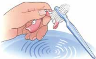
Reinig uw prothese na iedere maaltijd

Etenresten aan de binnen- en buitenzijde van de overkappingsprothese kunt u het beste verwijderen met behulp van een speciale protheseborstel, bijvoorbeeld van Lactona of Oral-B, en water. Gebruik géén tandpasta. Die kan te veel schuren. Een schoon kunstgebit voelt altijd glad aan. Laat uw gladde gebit tijdens het reinigen niet uit uw handen glijpen. Het zal kapot gaan. Vul voor de zekerheid eerst de wasbak met water en reinig uw kunstgebit daarboven.