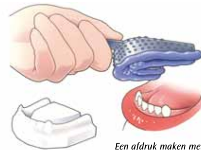
Een afdruk maken met een afdruklepel

Een afdruk van uw kaak wordt gemaakt met behulp van een afdruklepel, gevuld met een speciaal afdruk-materiaal. In het tandtechnisch laboratorium wordt die afdruk met gips gevuld. Hierdoor ontstaat een gipsmodel. Hierop wordt een goed passende afdruklepel van kunsthars gemaakt. Met deze lepel wordt nóg een afdruk gemaakt om een nóg nauwkeuriger gipsmodel te krijgen. Hierop wordt uw overkappingsprothese gemaakt.